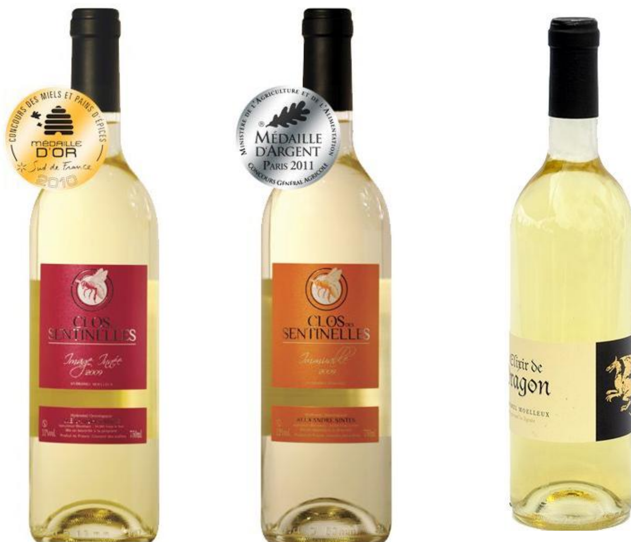
Moelleux haute gamme

Nous la déclinons en 6 variétés. Du Moelleux au sec.